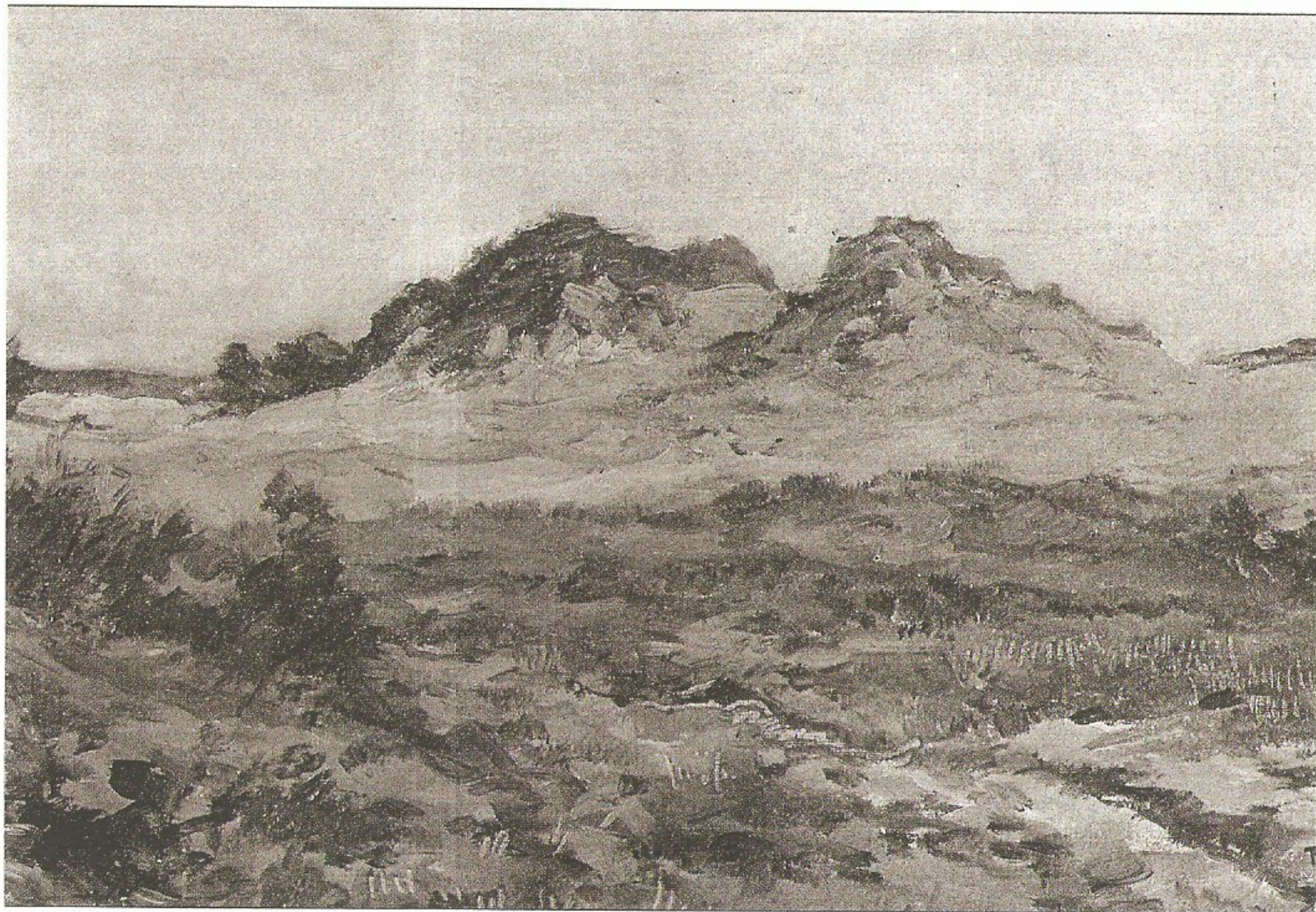
▲ Drunensche Duinen, circa 1942