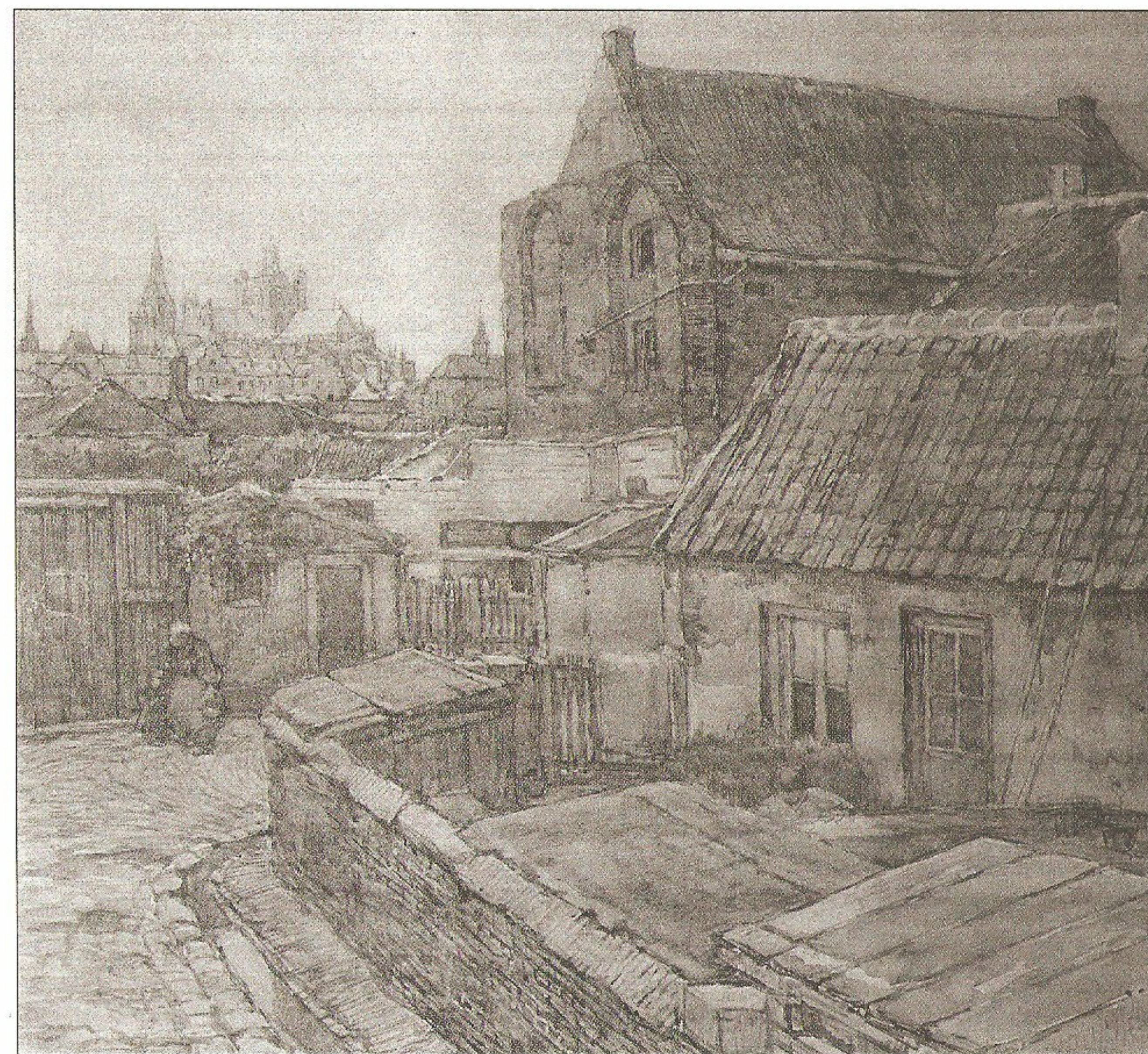
▲ Buurtje bij de ruïne van het Bethaniëklooster, 1923

waren door deze plas? Natuurlijk dankzij hun vader, die heel wat afsjouwde met zijn koters. Op hun zwerftochten in de omgeving van Vught konden ze eenvoudigweg 'niet om de plas heen', figuurlijk wel te verstaan. Na jaren van graven kwam de heide tot rust en lag daar een "statige, blanke plas" van 53 hectare groot. "De wolken speelden haar spel van licht en donker boven dit ruime land- en waterschap. Ze weerkaatsten in de gladde