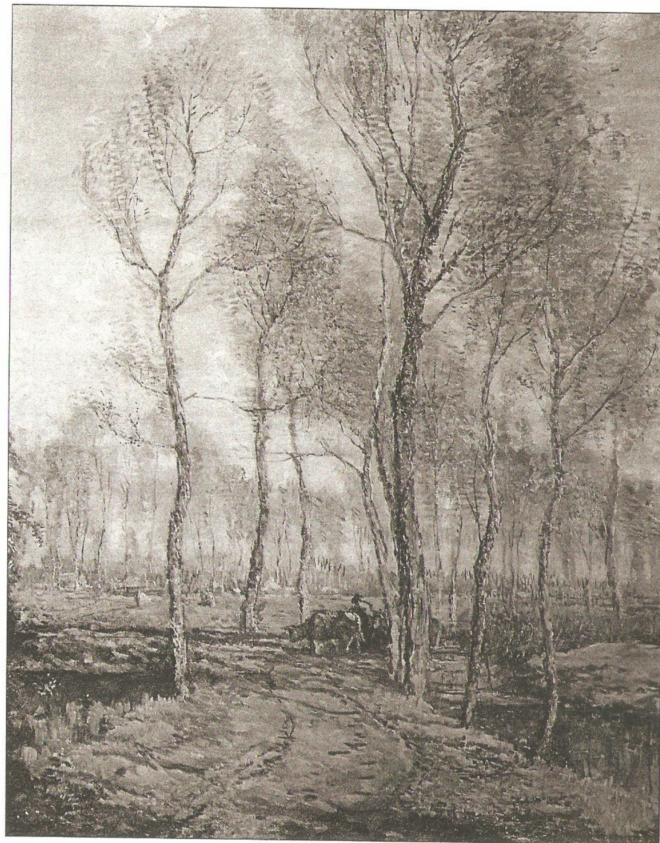
▲ Populierenlandschap, zonder opgave van jaar (collectie Museum Slager)

eentoonigen roep met de teere stemmen van het verre carillon. En de atmosfeer was zwanger van de uitwaseming der sappen van gemaaid gras en bloemen, den geur der hooioppers die afdreef naar de stad, en des nachts de straten en de vensters binnen drong." Als sensibele kunstschilder was Frans uiteraard gevoelig voor visuele indrukken. Daar bleef het niet bij, hij was meer dan dat, namelijk een uitgesproken 'zinnelijk' mens. Denk dan niet aan de afgeleide betekenis 'wellustig', maar aan de oorspronkelijke: 'onder het bereik van de zinnen vallend'. Van die 'zinnen' kennen we