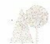
▼ IJzeren Man, zonder opgave van jaar (particuliere collectie)