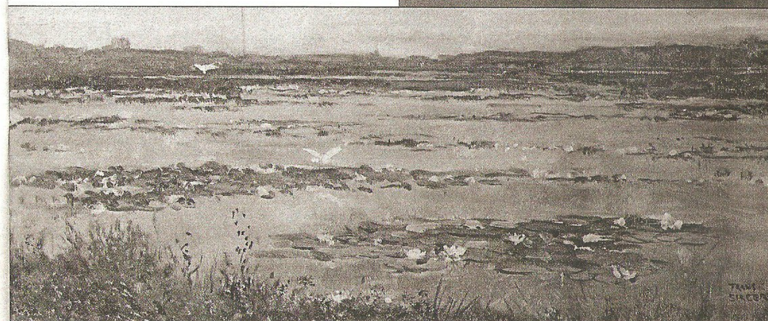
▲ Huisvennen, zonder opgave van jaar

De Slagers behoorden tot de eerste zwemmers in de IJzeren Man. In 1890 begon men een stuk van de Vughtse Hei af