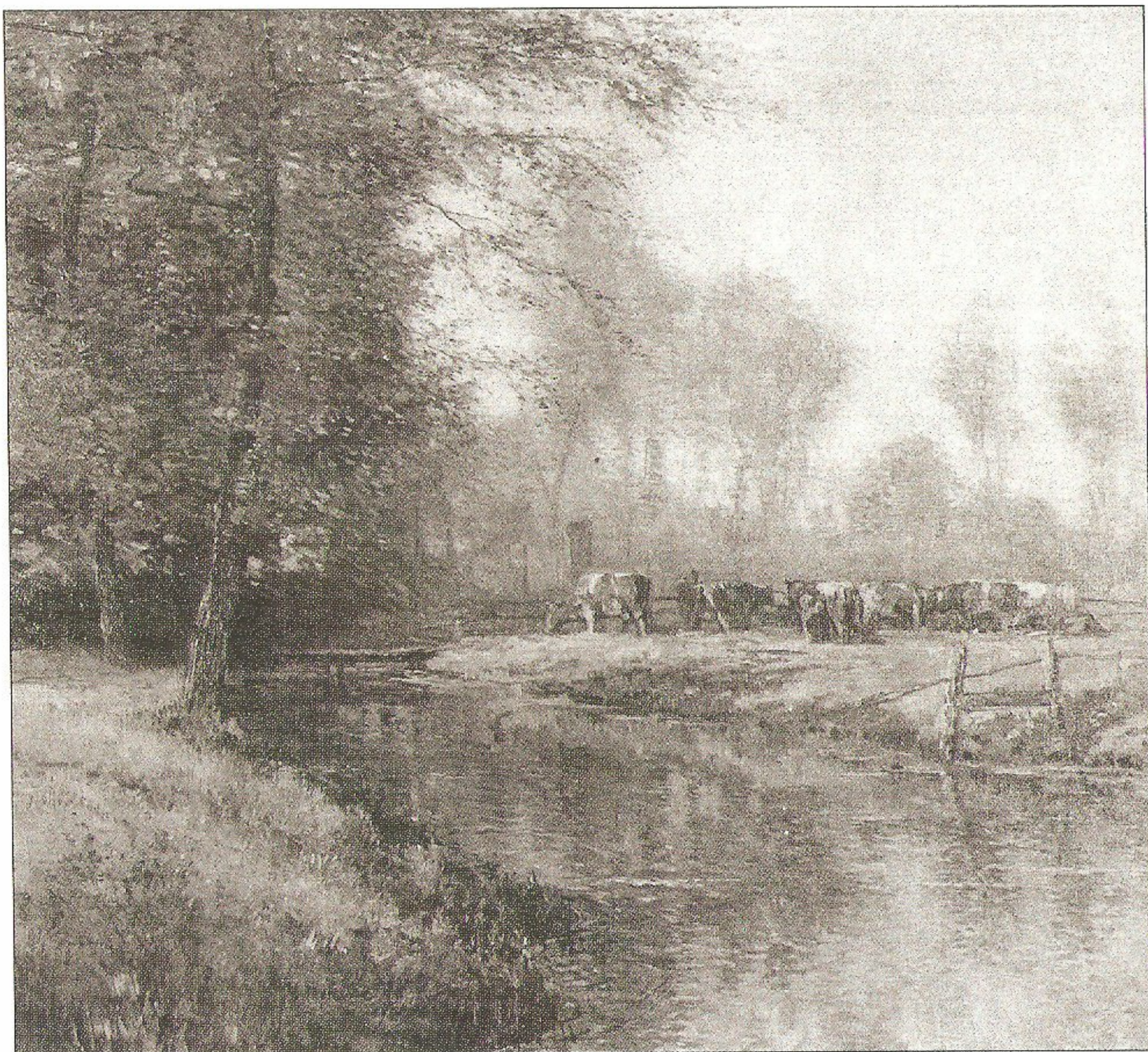
▲ De Nethen, zonder opgave van jaar (collectie Museum Slager)

te graven. Er was namelijk zand nodig voor de aanleg van een nieuwe wijk in 's-Hertogenbosch, 't Zand geheten, gelegen rond het Centraal Station. Van hun vroegste jeugd tot aan hun dood waren de Slagers gefascineerd door de IJzeren Man. Het aantal van hun doeken met deze plas als onderwerp loopt in de vele tientallen. Hoe komt het dat zo goed als alle broers en zussen uit het gezin van tien gegrepen